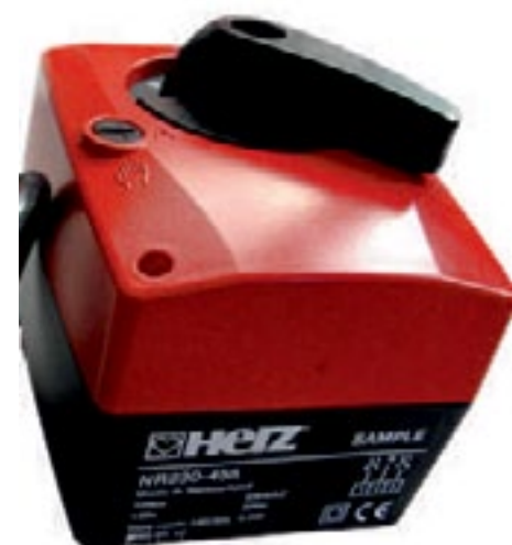
2 Napęd elektryczny do zaworu