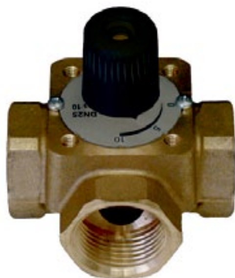
1 Zawór czterodrogowy HERZ 2138

Zastosowanie: regulacja strumienia czynnika grzewczego, chłodzącego, instalacje kotłowe.