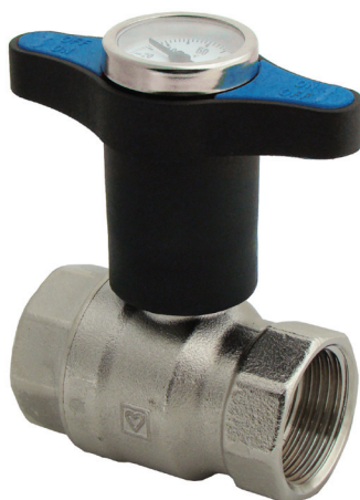
Zawór kulowy Herz Modul z termometrem

W ofercie zaworów kulowych firmy Herz dostępne są także zawory do instalacji wody pitnej – wody zimnej, ciepłej wody użytkowej i cyrkulacji – produkowane w zakresie średnic od 15 do 50 DN. Korpusy tych zaworów wykonywane są z kutego mosiądzu, odpornego na wypłuki-