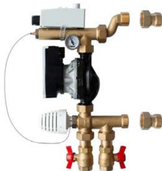
Fot. 2. Układ pompowo-mieszający Simple.