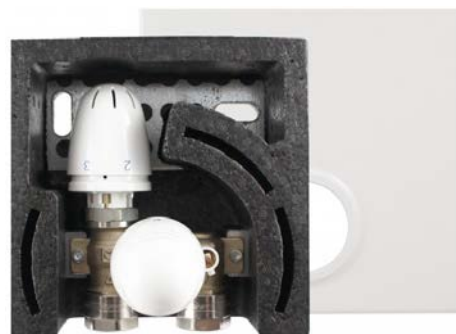
Fot. 3. Układ do bezpośredniego sterowania grzejnikiem podłogowym HERZ-FLOORFIX Compact.